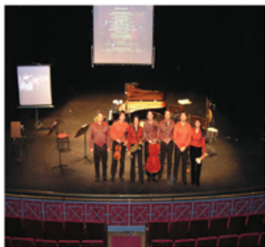
Conciertos pedagógicos CRIF Acacias