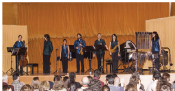
Festival Internacional de Tres Cantos