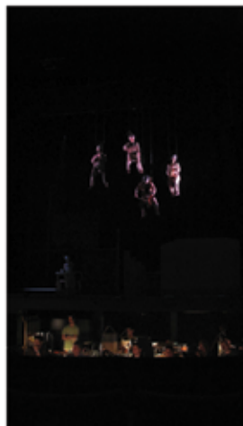
Teatro de la Zarzuela