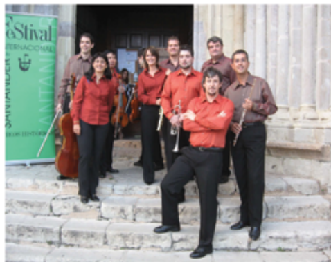
Festival Internacional de Santander